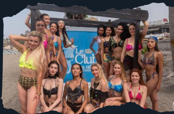
Fashion Week de New York